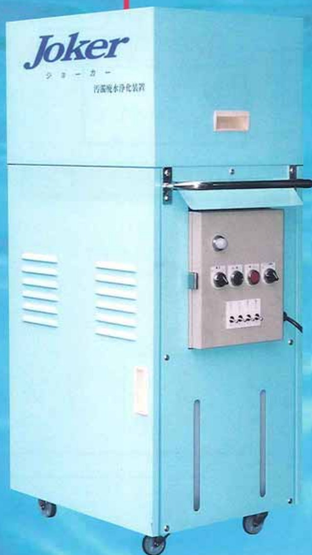
汚濁廃水浄化装置